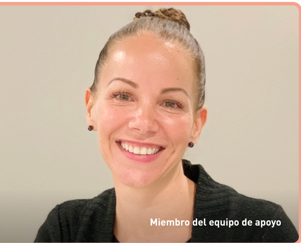
Miembro del equipo de apoyo

Usted queda automáticamente inscrito en el Servicio de Apoyo al Paciente de Acthar cuando su médico le envía la receta. El programa de apoyo ayuda a navegar por la cobertura del seguro y a aprender a administrar inyecciones.