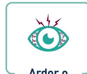
Ardor o escozor en los ojos