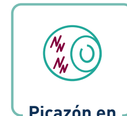
Picazón en los ojos

Doce pacientes informaron al menos 1 evento médico que no estaba presente al inicio del tratamiento. Algunos de estos incluyeron presión arterial alta, visión borrosa, visión doble e irritabilidad. Una persona informó un evento médico grave (sobredosis intencional) que no estuvo relacionado con el tratamiento con Acthar Gel. Los médicos que realizaron el estudio no observaron ningún aumento notable en la presión ocular.